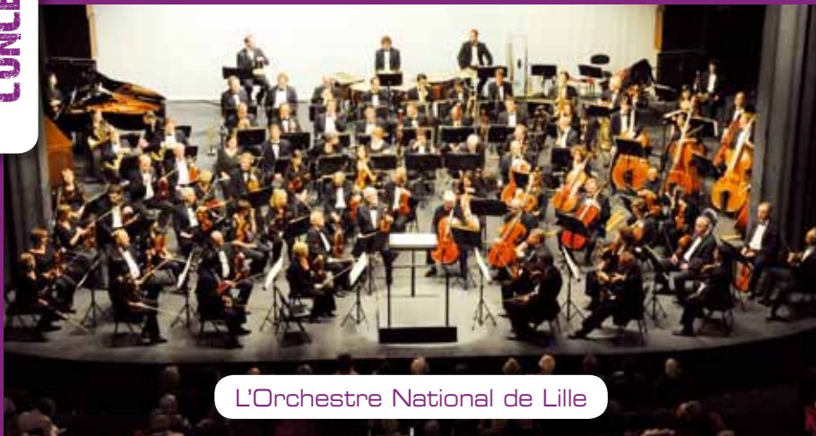
L'Orchestre National de Lille